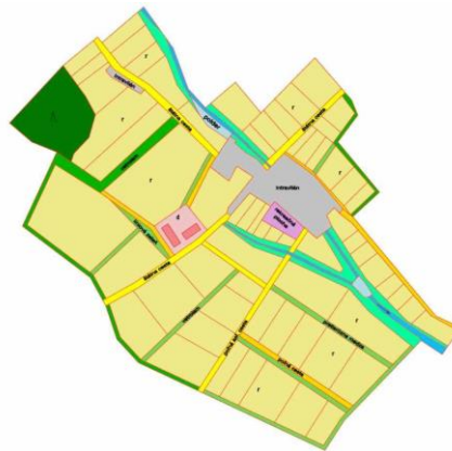
Stav po PÚ

Komplexnosť takýchto pozemkových úprav sa prejavuje dvojako - v rozsahu spracovávaného územia i v rozsahu problémov, ktoré chceme v území vyriešiť, teda v rozsahu navrhovaných zariadení a opatrení.